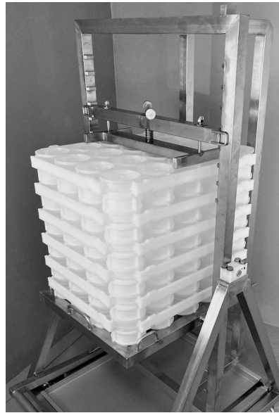
Bloc-moules à fonds